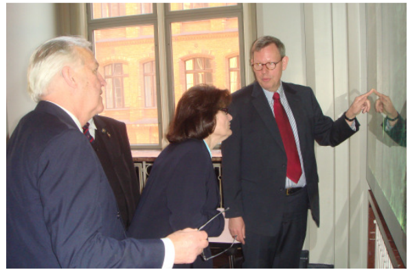
Protokoll-Chef Schütte (re) mit den Corbetts im Roten Rathaus

Am folgenden Tag wurde Sir Robert Corbett, der Träger des Landesverdienstordens von Berlin ist, im Roten Rathaus empfangen. Auf Einladung des Regierenden Bürger-