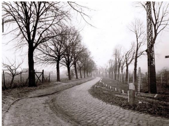
Dezember 1961: Kreuzung Bergstraße/Hauptstraße in Richtung Heerstraße. Die Leine mit Fähnchen markieren den Grenzverlauf

wie ein Drehbuch, selbst die Anzahl der Trauergäste war durch den Staatssicherheitsdienst bestimmt. Die Familie musste auf Dauer für die „Tat“ Wohlfahrts leiden.